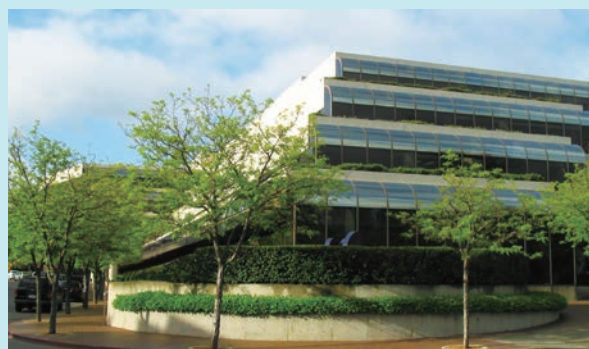
農薬の開発・販売拠点 ベーラントU.S.A. (米国)

から2000年代にかけて、農業化学事業では高度な研究開発力を生かし、農薬や家庭用殺虫剤などの新製品を相次いで上市しました。また、鶏などの餌に入れて成長を促す飼料添加物「メチオニン」の生産能力の拡大や、国内外でM&Aを推進するなど、規模を拡大していきました。