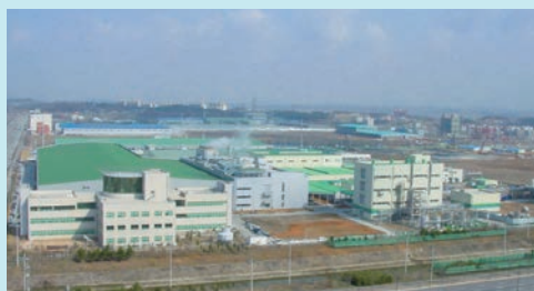
東友半導体薬品(現・東友ファインケム)(韓国)