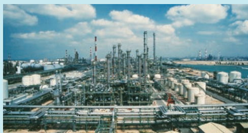
シンガポール石油化学コンビナート