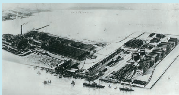
アンモニア工場第1期完成時の工場全景