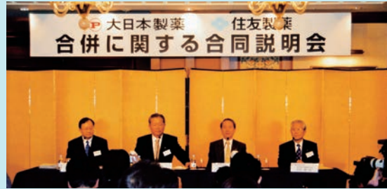
大日本製薬と住友製薬の合併に関する合同説明会

「ラービグ計画」は、サウジアラビアに世界最大級の石油精製・石油化学コンビナートを建設する一大プロジェクトです。当社は、優れた技術力とアジアでの確かな販売力、シンガポール石油化学の実績などの企業力が評価され、2004年にサウジ・アラムコ社との間で覚書を締結しました。そして2005年には、サウジ・アラムコ社との合併会社であるラービグ・リファイニング・アンド・ペトロケミカル・カンパニー（ペトロ・ラービグ社）を設立し、2009年から第1期計画、2019年から第2期計画が商業運転を開始しています。